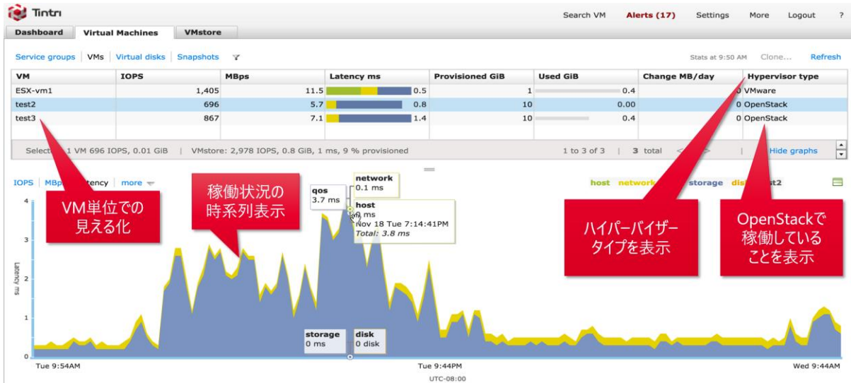
複数のハイパーバイザーと OpenStack 混在環境での管理の一元化

OpenStack 環境で専用ストレージを導入するのは、コスト的に難しい状況が多くありますが、既にティントリを仮想環境でご利用のお客様であれば、ストレージ筐体内で未使用の領域を OpenStack 向けに利用することが可能です。ティントリであれば、1つのストレージ筐体で、VMware、Microsoft Hyper-V、Red Hat Enterprise Virtualization に加えて OpenStack Cinder の複雑な混在環境であっても、ティントリのわかりやすいユーザーインターフェースにて VM 単位での稼働状況のリアルタイム解析を行うことができます。