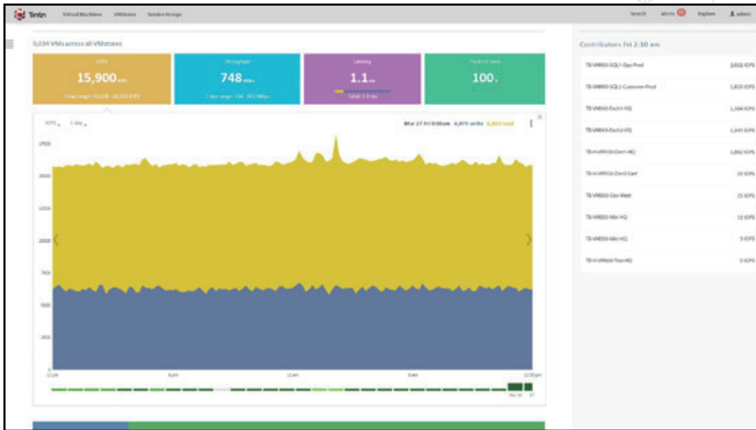
図2 - Tintri Global Center – 仮想マシン ダッシュボード - 総合的な情報および最も IOPS の高い上位10台の VM を表示